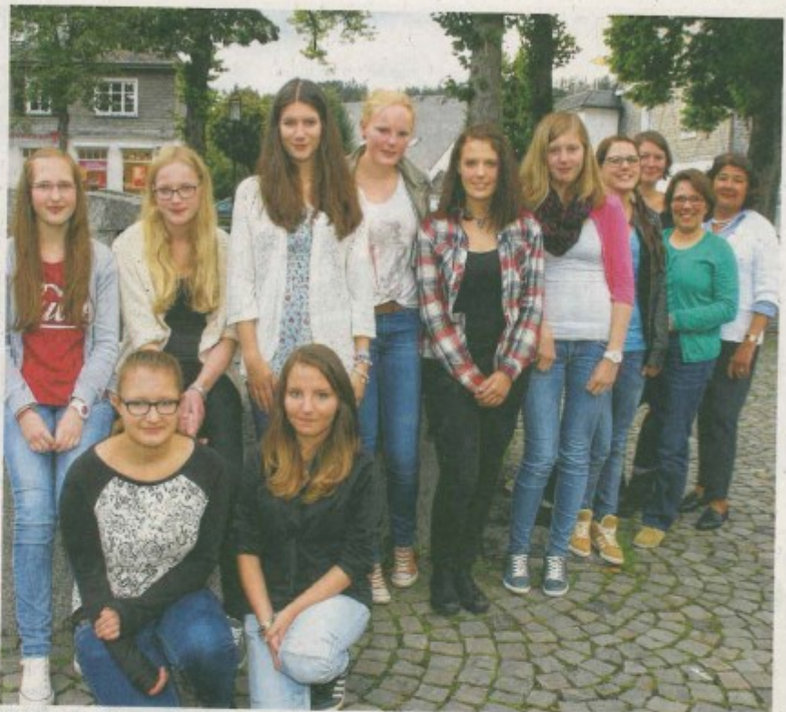
Eine kleine Projektgruppe, bestehend aus acht Jugendlichen und vier Betreuern, reist nach Wimereux.

Dafür reist eine kleine Projektgruppe, bestehend aus acht Jugendlichen und vier Betreuern, im September für vier Tage nach Wimereux. „Wir haben das Projekt an den weiterführenden Schulen vorgestellt und Flyer verteilt“, erzählt Diana Senger. „Mit der großen Resonanz haben wir nicht gerechnet.“ Ursprünglich war die Reise für vier Jugendliche geplant. Ange-