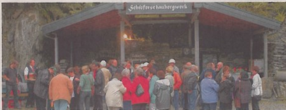
Unter Tage: Alle Teilnehmer der 1. Berleburger Museumsnacht in Schieferschauerbergwerk sind gut „bedient“ und freuen sich auf gute Musik des Raumländer Chores, von „Hewe Deeg“ und auf die klasse Bewirtung vor dem Stall.