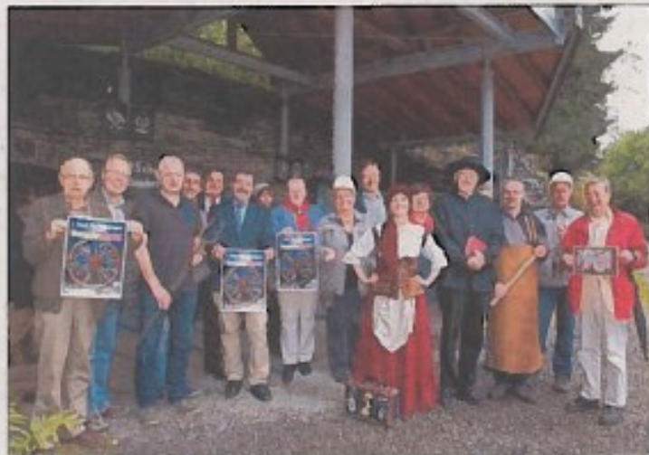
Vertreter der beteiligten Museen und Heimatstuben fanden sich im Schieferschaubergwerk Raumland ein, um das Programm der 1. Museumsnacht vorzustellen.