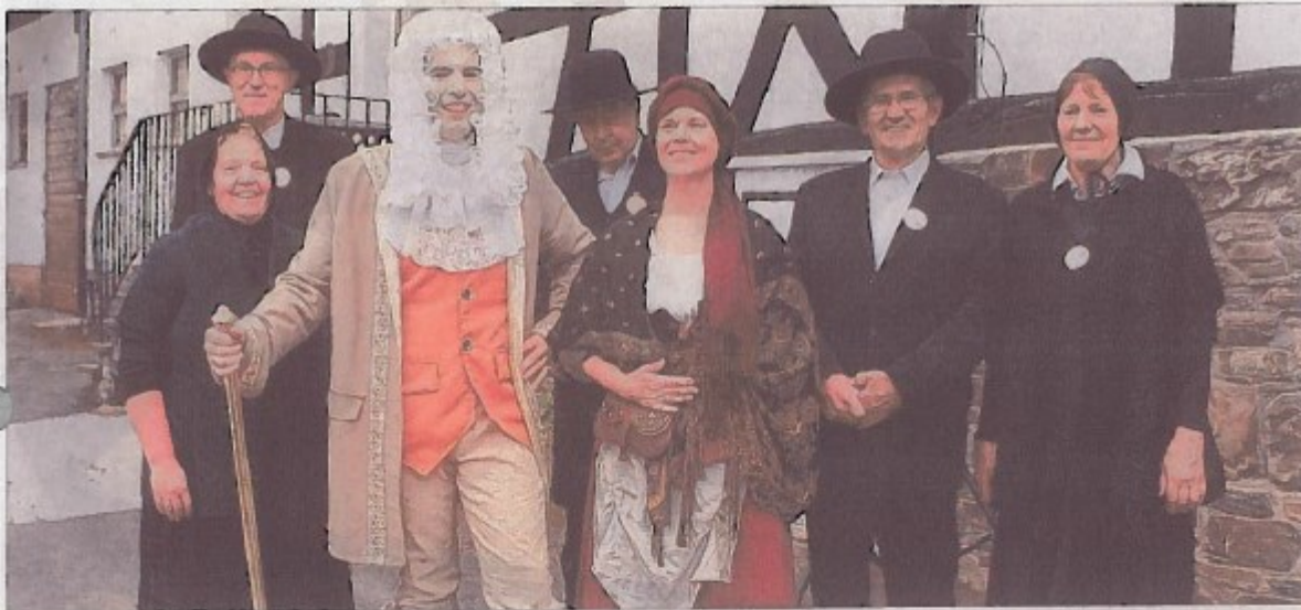
Die Schwarzenauer feierten rund um das Alexander-Mack-Museum ein tolles Pietisten- und Barockfest. Es spricht nichts dagegen, dass sich die Museumsnacht im Bad Berleburger Stadtgebiet fest etabliert.