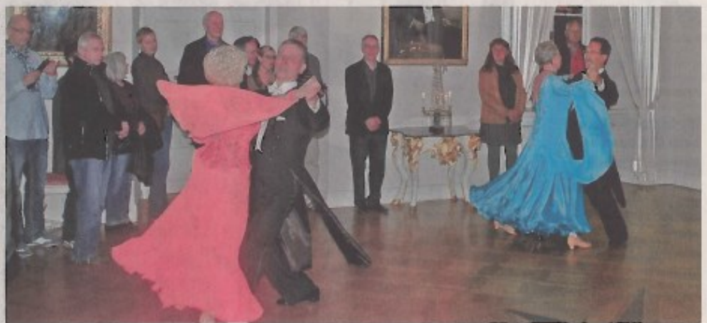
Ball auf Schloss Berleburg: Bei der Führung wurden die Teilnehmer durch plötzlich durch Saal Walzer tanzende Paare überrascht.