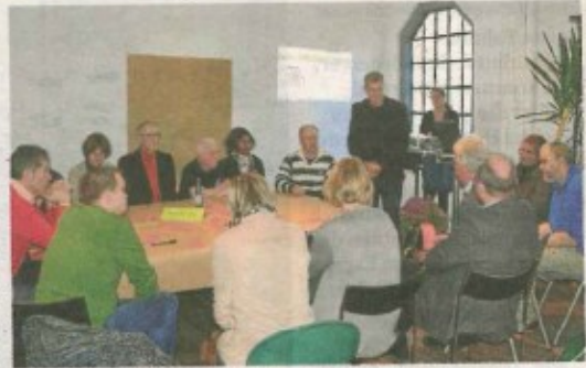
In kleinen Gruppen wurden die Schwerpunktthemen bearbeitet.