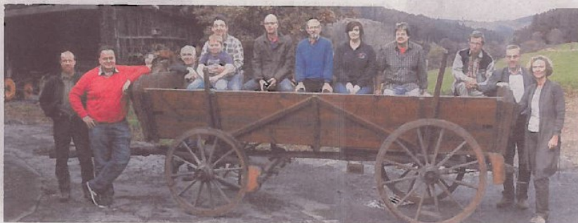
Stolz auf das, was sie geleistet haben – und trotzdem mit kritischem Blick auf die nächste Auflage: Einige der Vereinsvertreter, die an der Museumsnacht beteiligt waren.