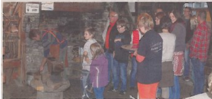
Schmieden bis das Eisen glüht – das wollten sich zahlreiche Besucher in Arfeld nicht entgehen lassen.