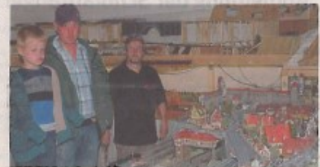
Die Modellbahnfreunde Arfeld nutzen die erste Museumsnacht in Bad Berleburg, um ihre Anlage vorzustellen.

Ebenfalls zu besichtigen gibt es einen Teil des Schwarzwaldes, der Alpen und die Altstadt von Rothenburg ob der Tauber. Zahlreiche Zugstrecken mit ICEs und Güterzügen galt es zu bestaunen, auch Lkw und Autos fahren per Magnetantrieb über die angelegten Straßen. Im Tag- und Nachtrhythmus konnten Besu-