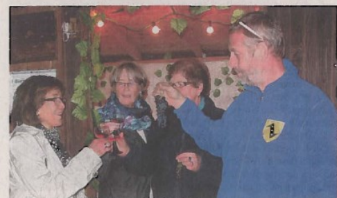
Zum Wohl! Am Heimathaus in Diedenshausen schmeckt der Wein.