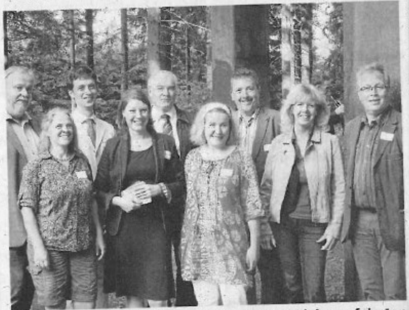
Vertreter aus Schmallenberg und Bad Berleburg feierten jetzt die Auftaktveranstaltung ihres gemeinsamen Projekts.

Die Gäste nutzten die Gelegenheit, sich mit den Verantwortlichen des Projekts in intensiven Gesprächen zu informieren, auseinander zu setzen, aber auch Wünsche zu formulieren. Musikalisch umrahmt wurde die Veranstaltung durch die Schmallenberger Bläserformation „Cornetto forte“. Die Bewirtung erfolgte durch den Verein „Rumilingene – 1200 Jahre Raumland“ aus Bad Berleburg. Auch hier eine reife Leistung interkommunalen Handelns.