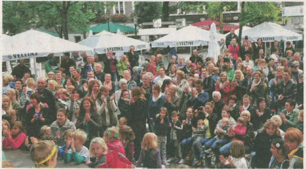
Schmallenberger Woche: Viele Menschen begeistern sich für Kultur-Fragen. Die Sinus-Milieu-Studie sagt für Schmallenberg: Wir sind bester Durchschnitt.

Nicht ganz. Auf der anderen Seite ist das traditionelle Milieu zum Beispiel etwas stärker vertreten als durchschnittlich in Deutschland. Dieses kennzeichnet sich unter anderem durch Sparsamkeit. Haus und Hof sind für diese Menschen