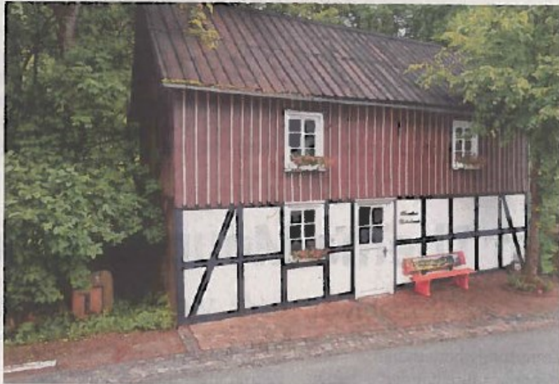
Am Heimathaus in Diedenshausen starten anlässlich der Museumsnacht zwei abendliche Dorfführungen mit dem Heimatverein.